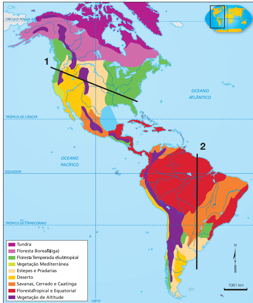
Vegetação original da América

FERREIRA, Graça M. L. Atlas geográfico: espaço mundial . 2. ed. São Paulo: Moderna, 2003. p. 80.