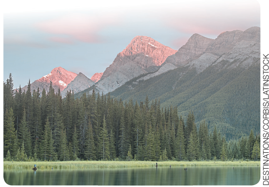
Floresta Boreal (Taiga) em Alberta (Canadá) 2009.