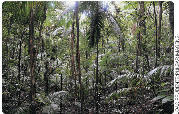
Floresta Tropical e Equatorial em São Miguel Arcanjo (SP), 2009.