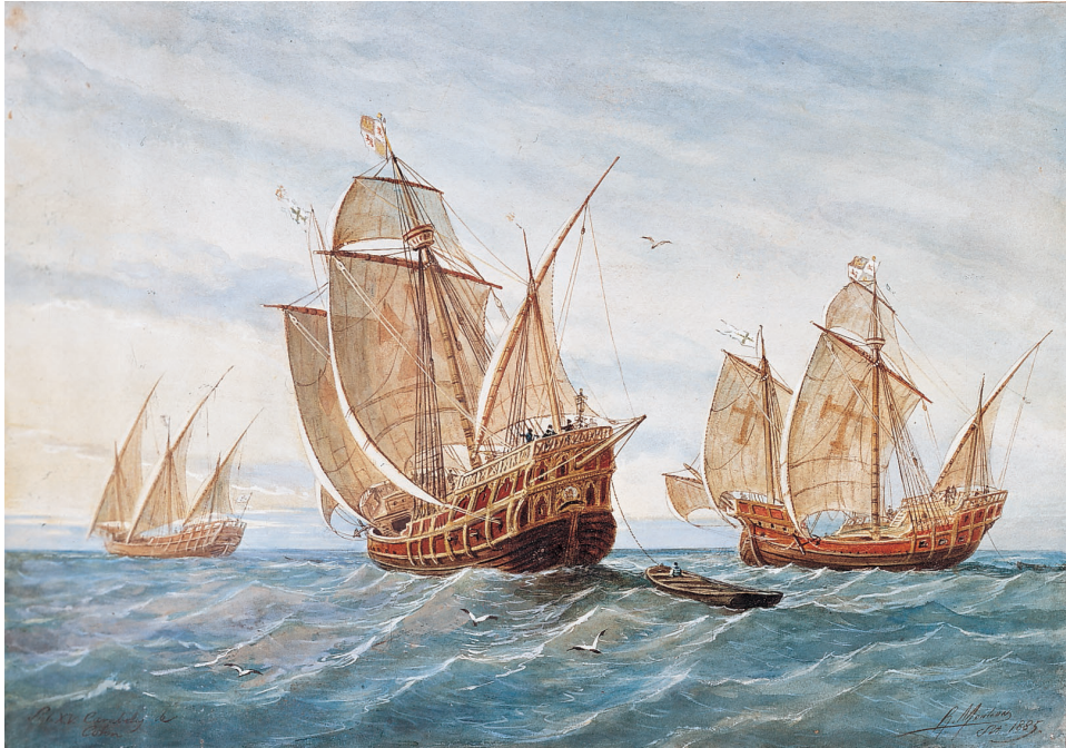
MUSEU NAVAL, MADRI, ESPANHA