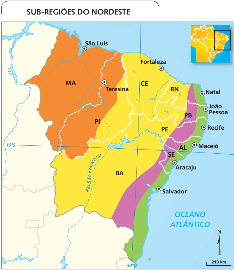
Fonte: ANDRADE, M. C. de. A terra e o homem no Nordeste . São Paulo: Brasiliense, 1973.

8. O mapa mostra as quatro sub-regiões do Nordeste. Complete a legenda, identificando o nome de cada uma delas.